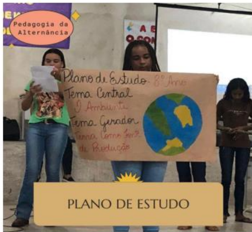
Apresentação, na forma de teatro, slides, cartazes, jogral, etc., do Projeto Multidisciplinar de Artes sobre as temáticas: “Quem sou eu?, Terra como fonte de produção, Trabalho na comunidade e Perspectivas e perfil profissional.” Data: 13/04.