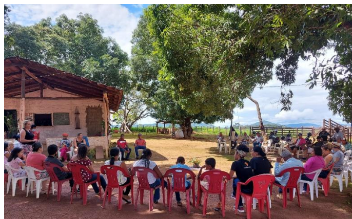
Reunião com as mulheres do Jardim Municipal