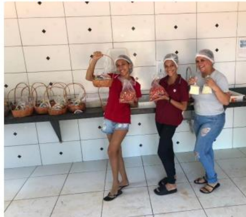
Imagem 4. Preparo das lembrancinhas