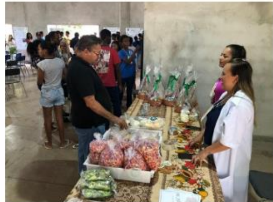
Imagem 12. Exposição de produtos da EFAPN