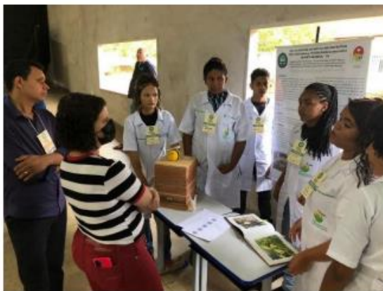
Imagem 13. Avaliação de projeto