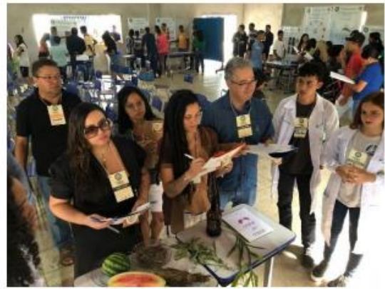
Imagem 10. Avaliação de projeto