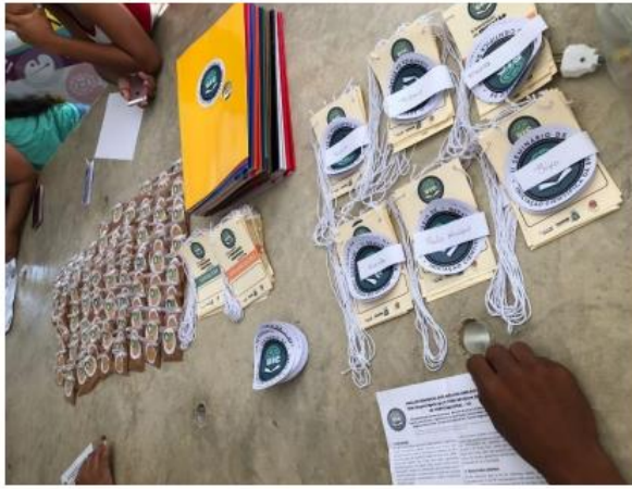
Imagem 1. Organização das pastas e crachás