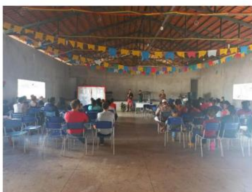
Palestra e discussão sobre Drogas com ex-dependentes da Fazenda da Esperança – Data: 17/08.