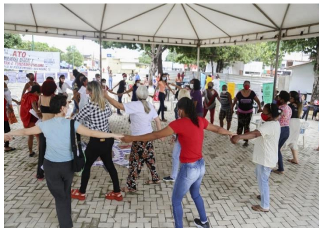
Multirão pela fome