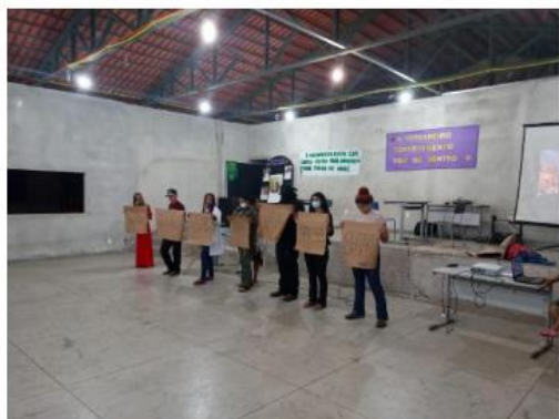
Apresentação de Projeto Multidisciplinar de Artes