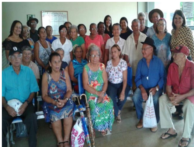
Mulheres comemorando a Pascoa.