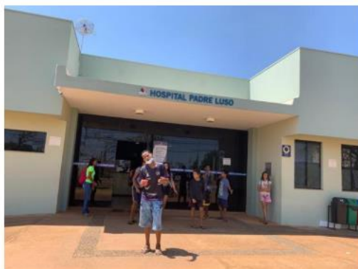
Visita de Estudos no Hospital Padre Luso em Palmas – TO sobre a temática de Plano de Estudo: Saúde na Família.