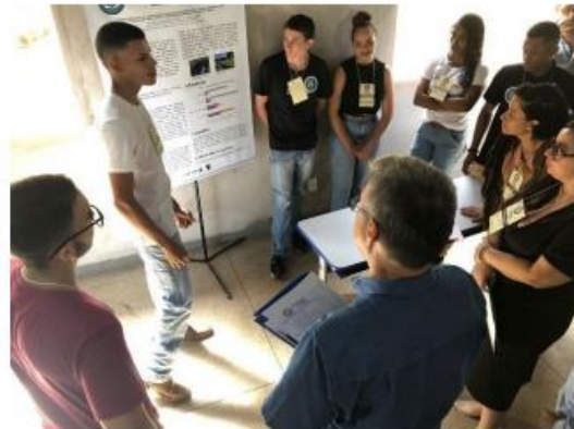
Imagem 8. Avaliação de projeto