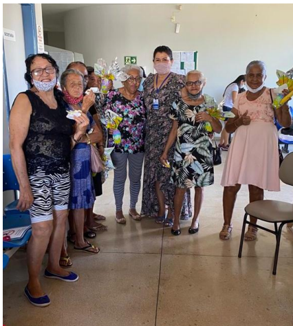
Grupo em anos anteriores