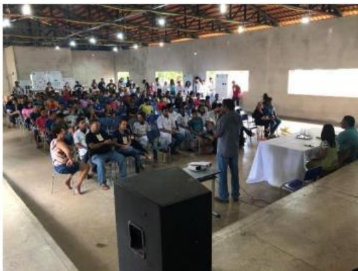
Imagem 5. Salão organizado para abertura