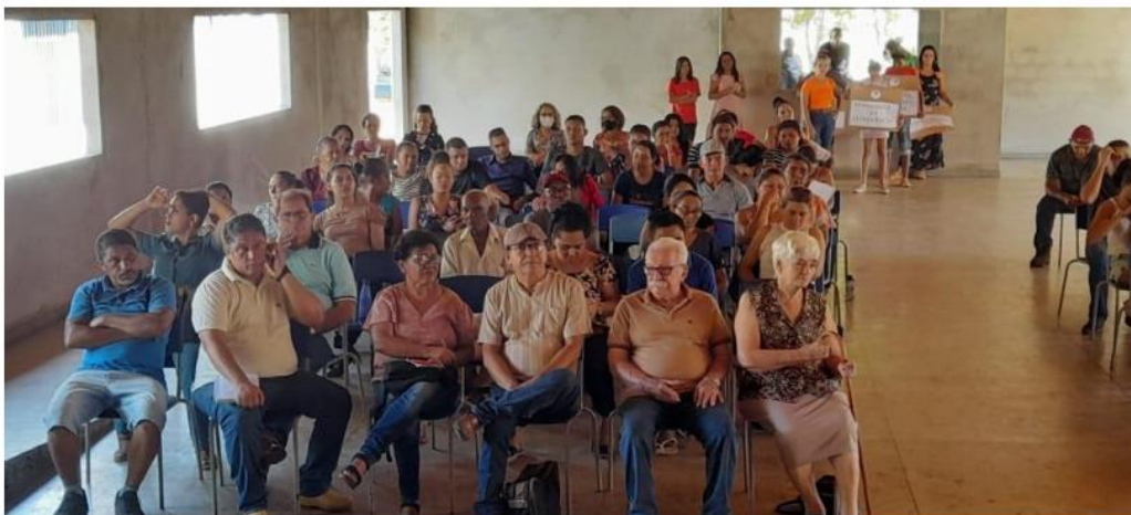
II Encontro de Formação das Famílias da Escola Família Agrícola de Porto Nacional – TO do ano letivo de 2022.