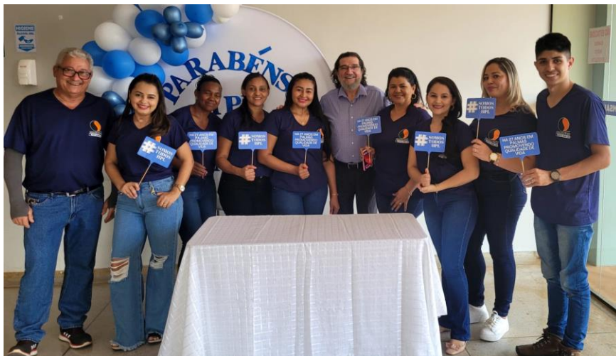
Participação da equipe do hospital na confraternização anual da Comsaúde

Comemorando 27 anos do HOSPITAL PADRE LUSO/ COMSAÚDE em Palmas.