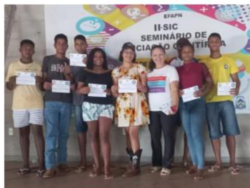
Imagem 20. 2º Lugar na Categoria: Aplicação do Método Científico e 2º Lugar na Categoria: Apresentação Oral