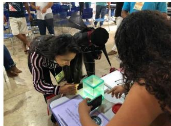
Imagem 14. Avaliação de projeto