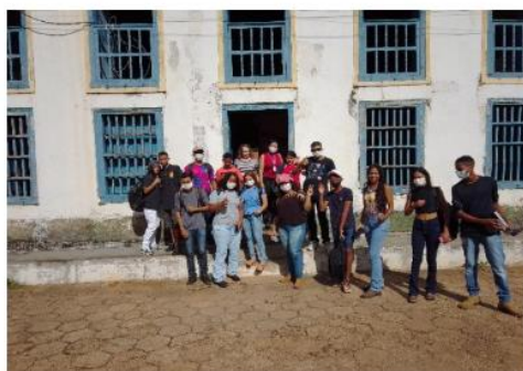
Visita ao Museu Municipal de Porto Nacional