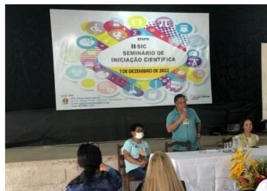
Imagem 6. Mesa composta, com fala do diretor