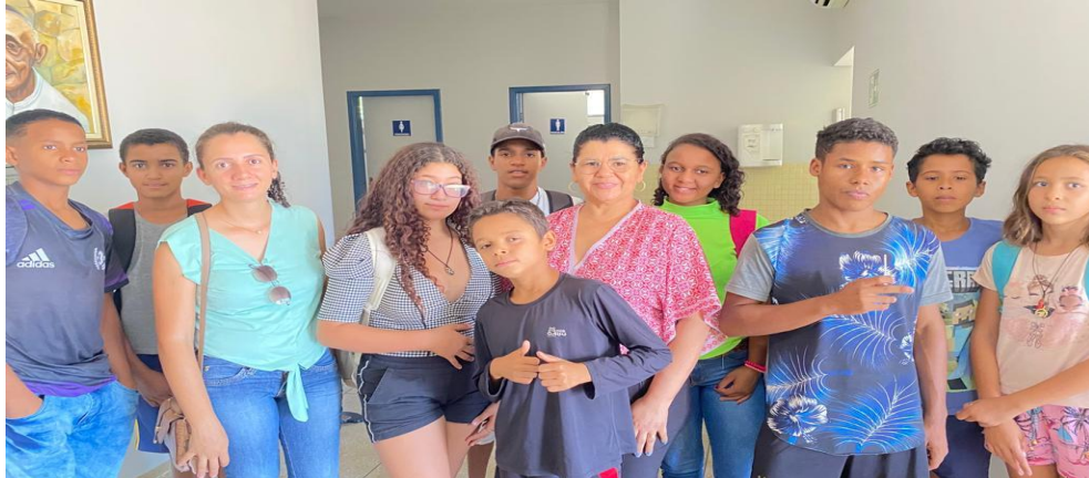
Alunos da EFA visita e conversa sobre o SUS

Revisão de todos os Programas, Normas e Rotinas desse serviço de saúde, foram feitas no inicio do ano, como sempre é feito.