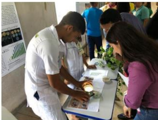
Imagem 15. Avaliação de projeto