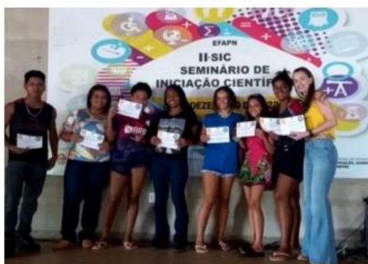
Imagem 21. 1º Lugar na Categoria: Trabalho em Equipe