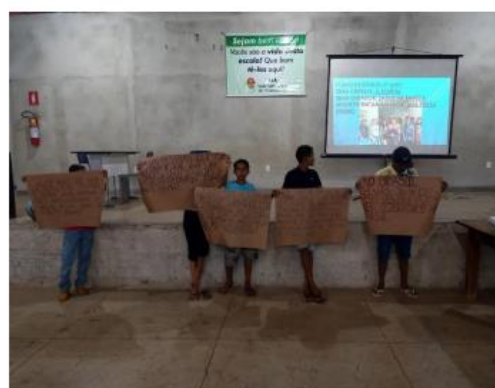
Apresentação de Projeto Multidisciplinar de Artes sobre as temáticas: saúde na família, cerrado e seus recursos, comercialização da produção e tecnologias no campo. Data: 28/09.