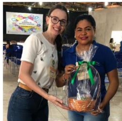
Imagem 16. Avaliadora recebendo sua lembrancinha