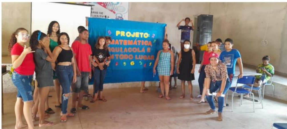
Jogos entre equipes