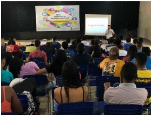
Imagem 7. Palestra de abertura