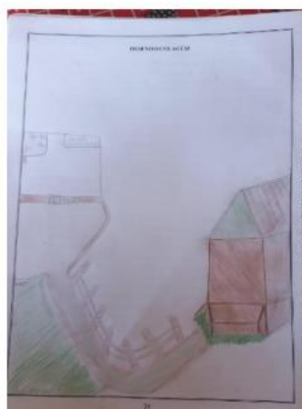
Desenho no Caderno de Tutoria/ Realidade do PE Trabalho na Comunidade.