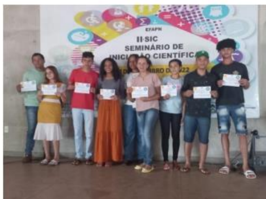
Imagem 19. 1º Lugar na Categoria: Aplicação do Método Científico