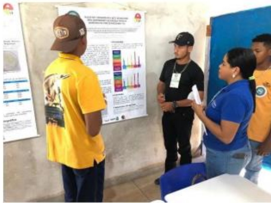
Imagem 9. Avaliação de projeto