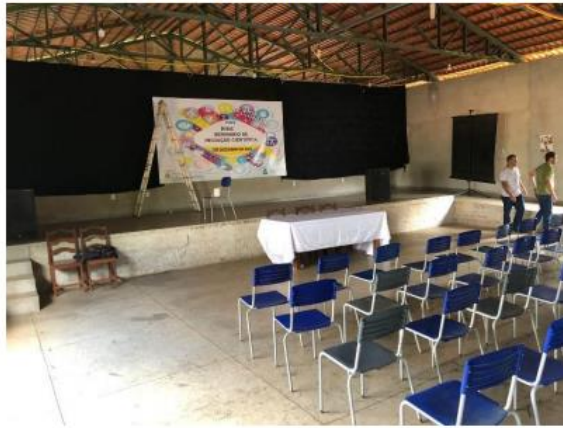
Imagem 3. Organização do salão