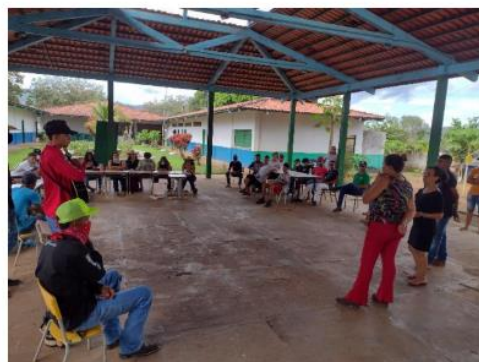
Visita de Estudos ao Assentamento São Francisco - Palmas/TO.