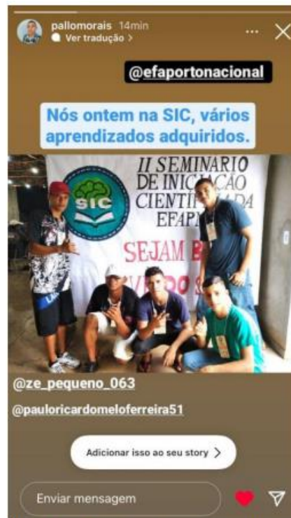
Imagem 18. Demonstrações nas redes sociais de estudantes