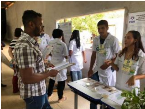
Imagem 11. Avaliação de projeto