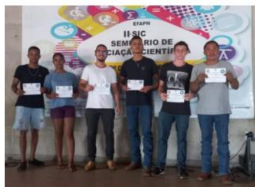
Imagem 22. 2º Lugar na Categoria: Trabalho em Equipe