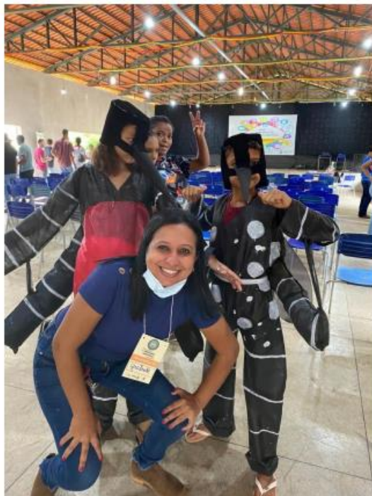
Imagem 17. Professora com estudantes do 6º Ano caracterizados para apresentação