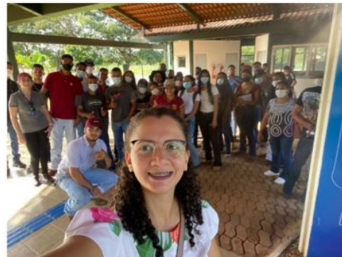
Visita de Estudos à Faculdade Católica Palmas/TO.