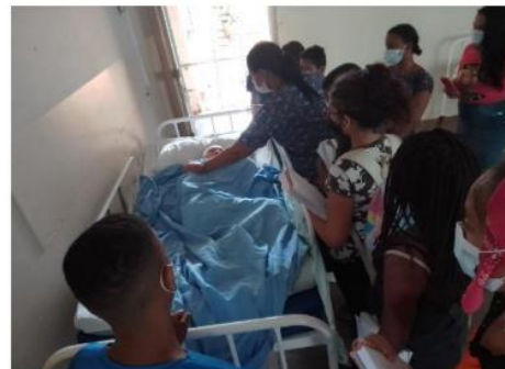
Visita de Estudos ao Abrigo João XXIII, Porto Nacional.