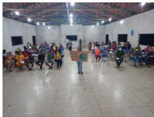
Apresentação do Projeto Multidisciplinar de Artes