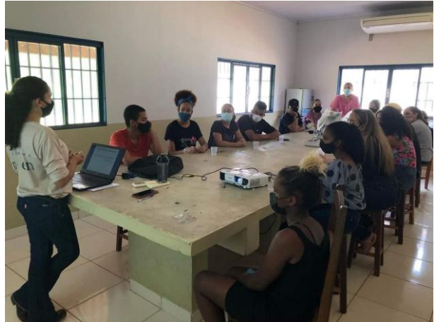
Legenda: Visita dos estudantes da escola CEM Félix Camoa