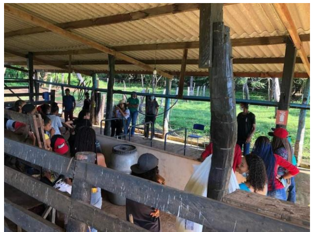
Legenda: Manejo de ordenha - aula prática no Setor de Bovinocultura Leiteira