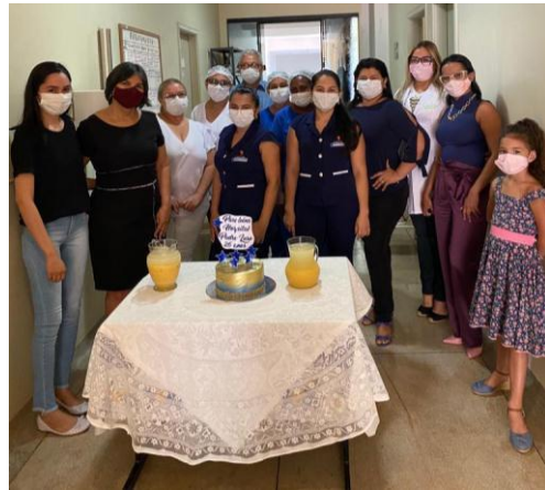
Legenda: Comemorações na equipe e dos 26 anos de Hospital em Palmas ainda sem a comunidade devido a pandemia