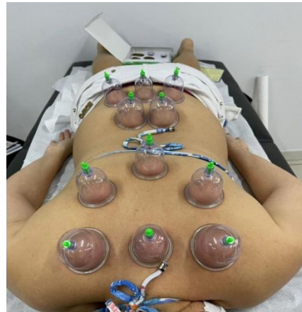
Legenda: fotos autorizadas pelos pacientes