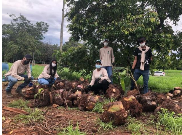
Legenda: Implantação do Sistema Agroflorestal - SAF