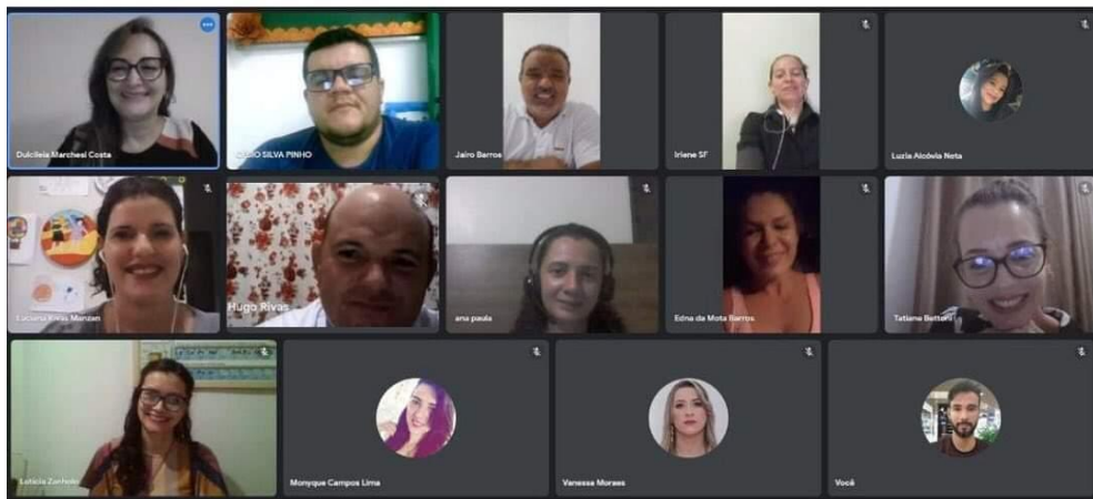
Legenda: Defesas PÓS-GRADUAÇÃO EM DOCÊNCIA PARA A EDUCAÇÃO PROFISSIONAL E TECNOLÓGICA