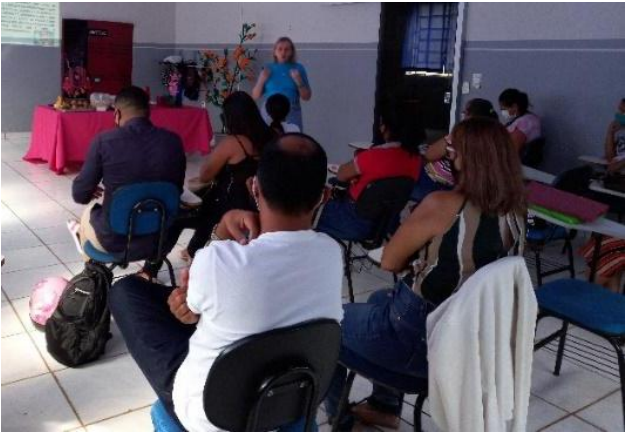
Legenda: Palestras nas ub's