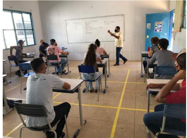
Legenda: Teoria e prática