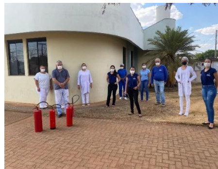
Legenda: Treinamentos de manuseio de extintores de incêndio