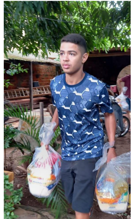
Legenda: Entre de cestas na comunidade