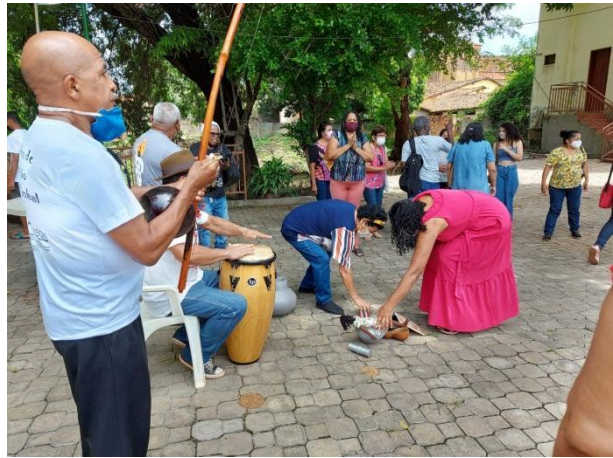
Legenda: Evento dos 20 anos da consciência negra - GRUCONTO