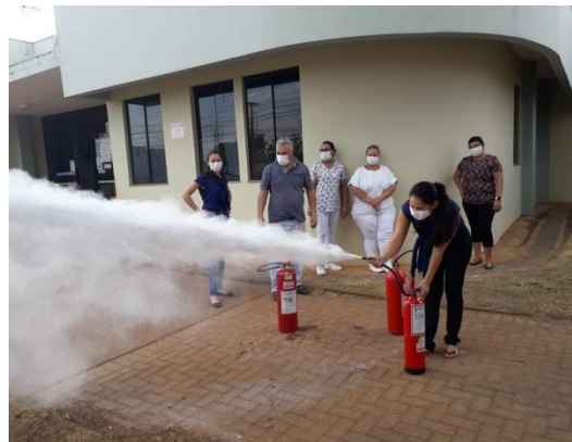
Legenda: Treinamentos de manuseio de extintores de incêndio