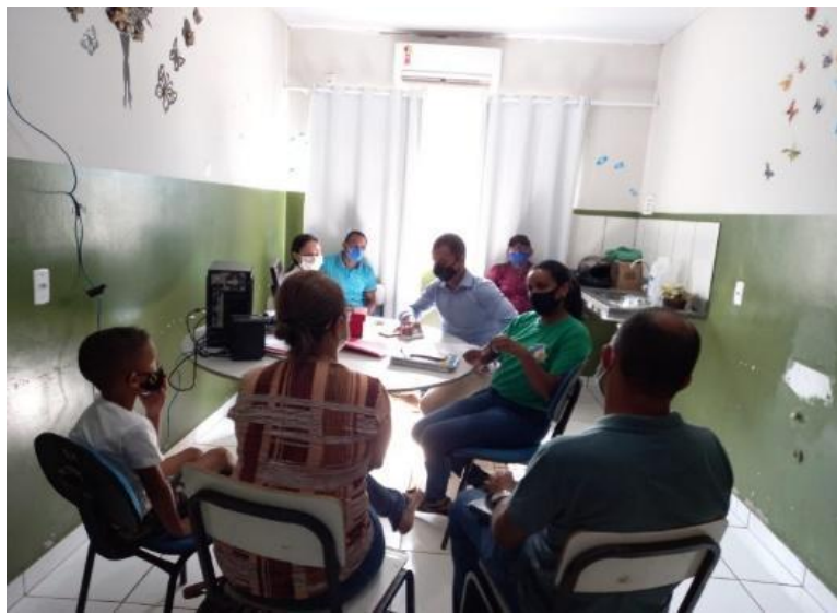
Legenda: Visitas nas Ubs objetivo informar sobre o projeto