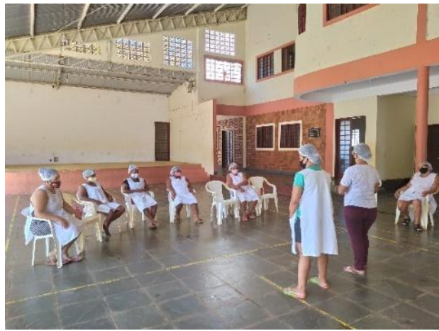
Legenda: Panificação de pães