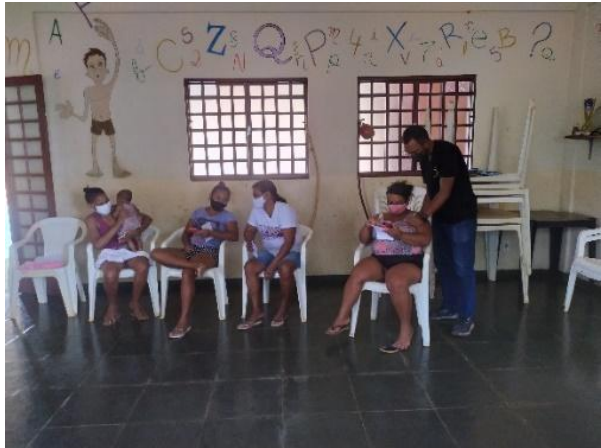
Legenda: Alfabetização Digital