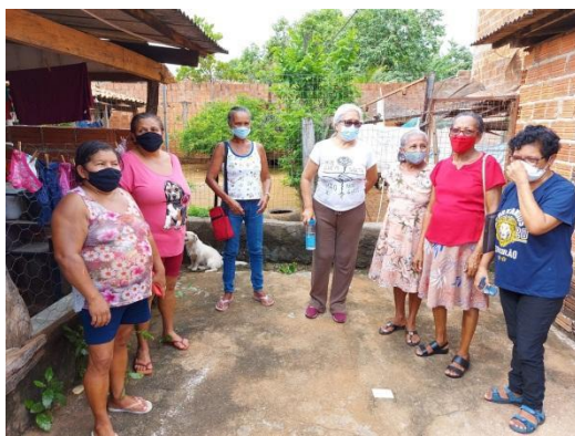
Legenda: Entrega de cestas básicas para a comunidade

COMUNIDADE DE SAÚDE, DESENVOLVIMENTO E EDUCAÇÃO. Rua Coronel Pinheiro, 1785, Centro, Porto Nacional-TO, CEP: 77500-000 Brasil Fone: (63) 3363-1289 E-mail: comsaude.to@gmail.com CNPJ: 01.189.836/0001-49 Site: www.comsaude-to.com.br COMSAÚDE - Há 52 Anos Construindo Um Mundo Melhor.