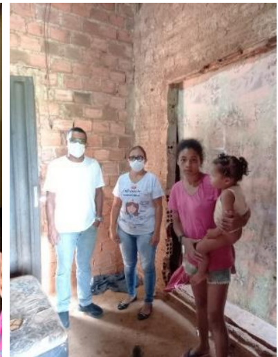
Legenda: Vistas domiciliares nas residências das famílias e pesagem das crianças