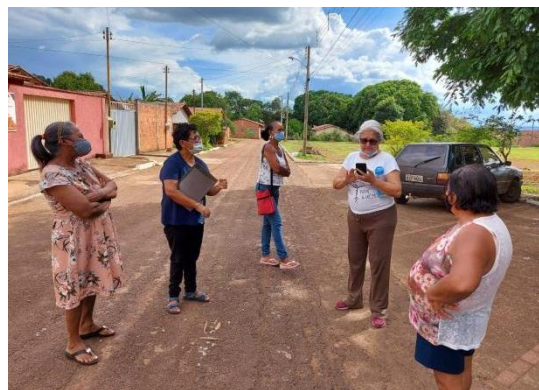
Legenda: Quintais produtivos