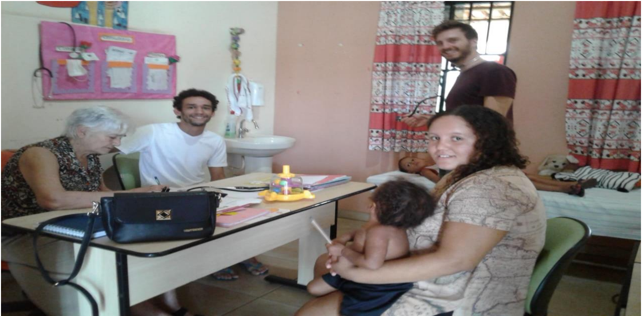
As crianças que receberam alta 2018 recebendo um kits