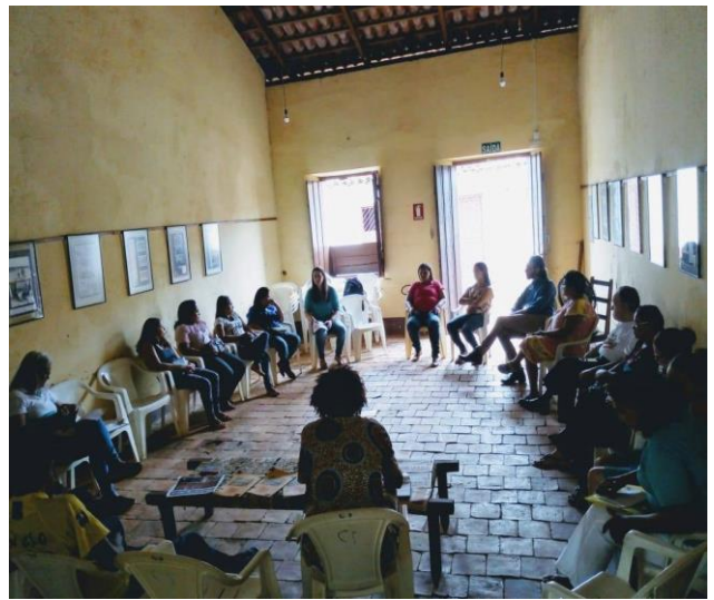
Visita dos acadêmicos da UFT, campus Porto Nacional.